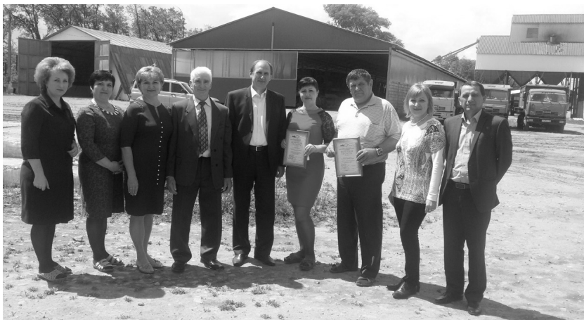
Награды за труд (крестьянское хозяйство «Молчановых»)

расследовании 14-ти несчастных случаев на производстве, оказывал помощь первичным профсоюзным организациям в обучении профактива, проводил обследование условий труда на рабочих местах. В своей работе он сотрудничал с технической инспекцией труда территориальных объединений организаций отраслевых профсоюзов, с государственными инспекторами труда, органами по труду местных администраций.