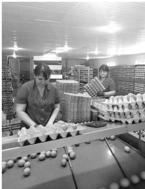
Подготовка продукции к реализации

ны труда. Ежегодно увеличивают финансирование на их реализацию, дополнительные социальные гарантии, компенсации и льготы. Работникам предоставляются дополнительные отпуска, ежегодно индексируется заработная плата.